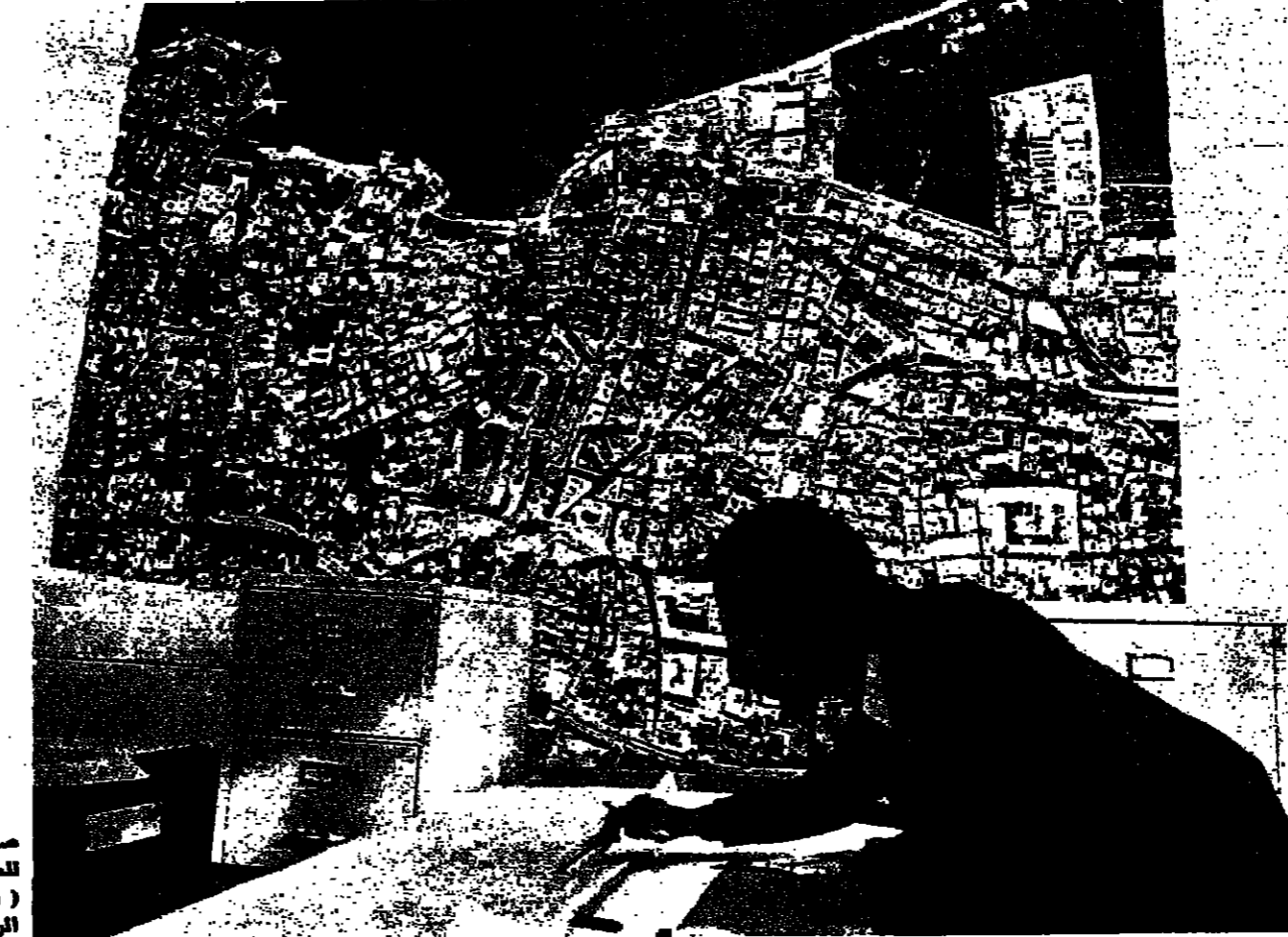
صور جوية وخرائط للعاصمة